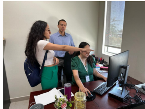
Visita al Hospital General del Estado