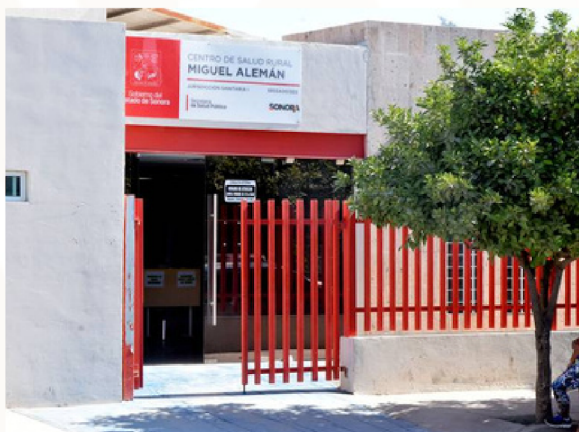
Centro de Salud Rural y estabilización “Miguel Alemán”

A continuación se realizó el traslado al poblado Miguel Alemán, ubicado a 1 hora de la ciudad de Hermosillo, donde se visitó el Centro de Salud Rural y Estabilización “Miguel Alemán” donde realizamos un recorrido por las instalaciones y conocimos el área de Teleconsultorio.