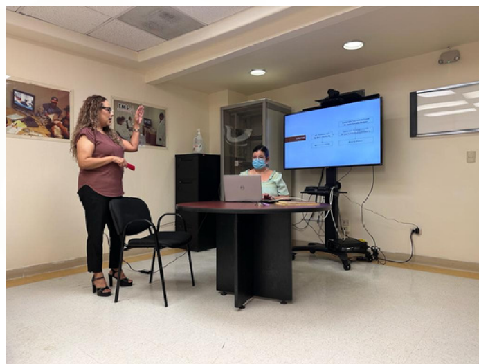
Sala de Telecomando del HIES