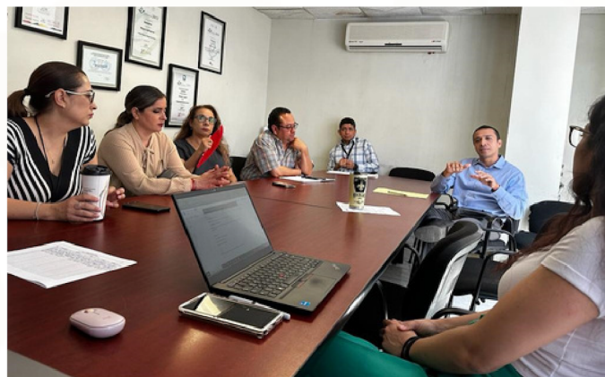
Reunión en las oficinas de los Servicios de Salud del estado de Sonora