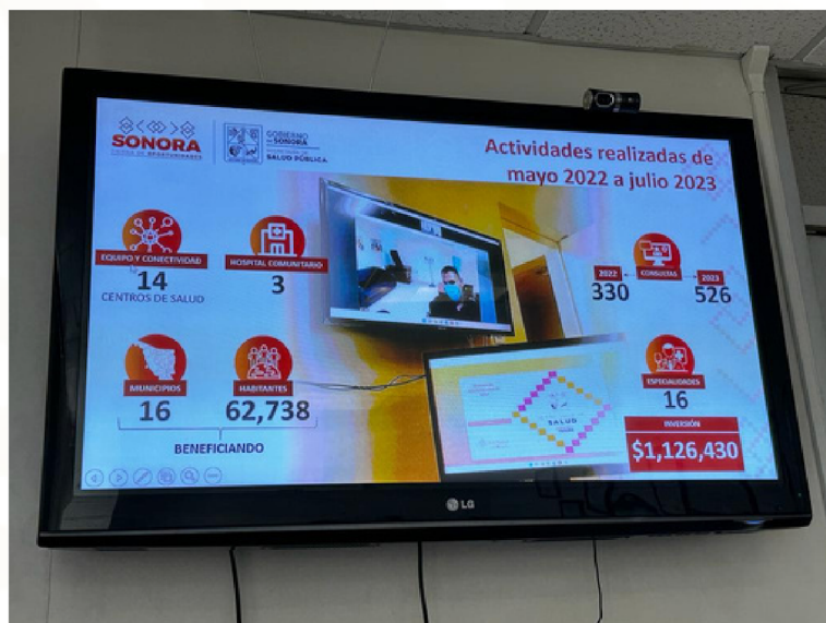
Actividades realizadas en el estado de Sonora en materia de Telesalud

Posteriormente se realizaron comentarios y observaciones al proyecto y se tocaron temas como los nuevos formatos de reporte en Sistema Nacional de Información Básica en Salud (SINBA) y las actualizaciones que están pendientes en el sistema. Se comentaron algunos de los proyectos a nivel federal que se encuentran en desarrollo como el de Teleictus por parte de CENAPRECE y el de Implementación de Centros de Lectura a Distancia de Mastografías por parte del Centro Nacional de Equidad de Género y Salud Reproductiva, en este último mostraron gran interés y desean participar.