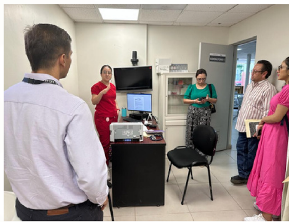
Sala de Teleconsulta del Centro de Salud “Miguel Alemán”

De esta visita podemos concluir que el estado de Sonora tiene un gran avance en su programa de Telemedicina, en los últimos años ha realizado una gran inversión en la implementación de la red de telemedicina.