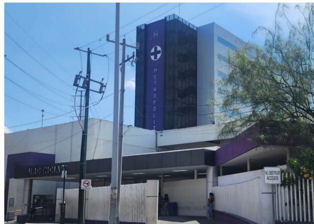
Hospital Metropolitano “Dr. Bernardo Sepúlveda”

Se revisaron algunas de las áreas de telemedicina en las unidades de telesalud consultantes e interconsultantes como el Hospital General Dr. Arroyo y Hospital General de Linares.