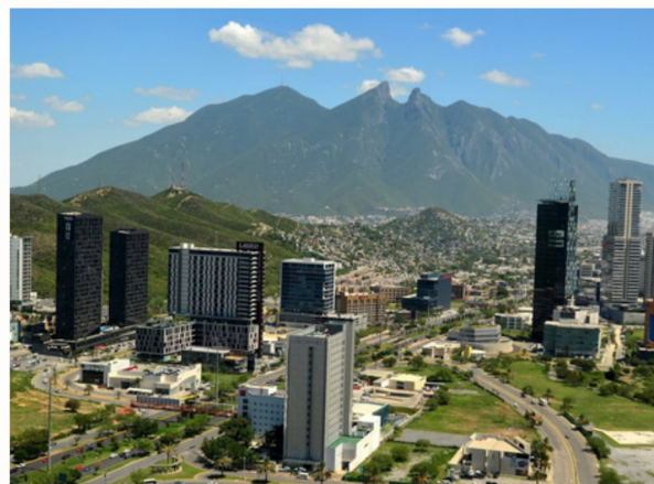
Monterrey, Nuevo León

Dentro de las atribuciones del CENETEC, se encuentra el establecer coordinación permanente con los organismos nacionales e internacionales dedicados a telesalud para el intercambio de información y participación continua, con esto en mente el pasado 6 y 7 de junio, se realizó una visita a la ciudad de Monterrey, Nuevo León; con el fin de conocer en sitio de los servicios de Telesalud y dar seguimiento a los proyectos de Telemedicina en el estado.