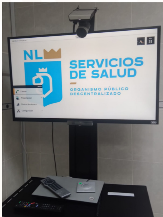
Sala de Telecomando del Hospital Metropolitano

Se realizó una reunión con personal del Departamento Estatal de Telesalud de los Servicios de Salud de Nuevo León, la cual se ubica en el Hospital Metropolitano "Dr. Bernardo Sepúlveda" se contó con la participación de la Coordinación de Teleeducación y el Jefe del Departamento de Telesalud; con el objetivo de realizar la revisión en sitio del estatus de programa de telemedicina en los Servicios de Salud de Nuevo León y seguimiento del proyecto de Teleeducación y Telementoría.