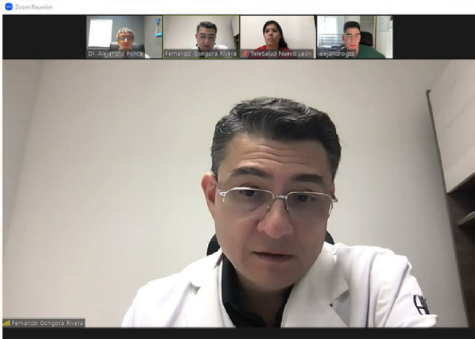
Sesión de Telementoría en Nuevo León

Se tuvo reunión de trabajo con personal de atención especializada a distancia del Hospital Universitario. Dr. José Eleuterio González, para revisar la logística de proyecto de Telectus en el Hospital General de Sabinas, en dicho proyecto la coordinación de Telesalud a través del área de Teleeducación será la encargada de montar el material teórico del curso en su plataforma Moodle para capacitar en línea al personal y podrá llevar a cabo la capacitación práctica de manera presencial.