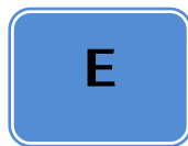
Tabla de referencia de símbolos empleados en esta guía:

Los niveles de las evidencias y la graduación de las recomendaciones se mantienen respetando la fuente original consultada, citando entre paréntesis su significado. Las evidencias se clasifican de forma numérica y las recomendaciones con letras; ambas, en orden decreciente de acuerdo a su fortaleza.